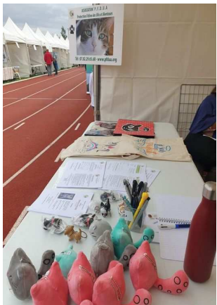
Notre stand PFDUA au Village des Associations des Ulis 5/09/2020